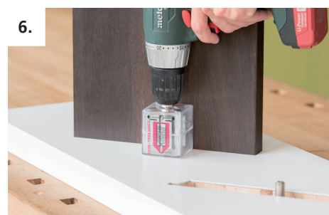
6. Una el peldaño con la zanca y apriételos con el Min Mag