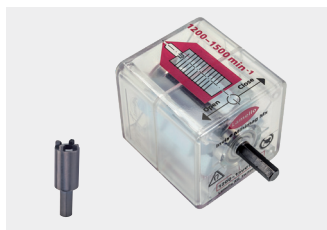
MiniMag Mx2 Kit