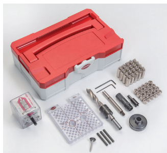
Invis Mx2 Starter Kit