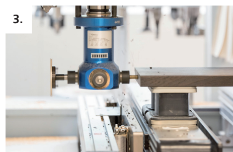
3. Haga un taladro en el costado del peldaño