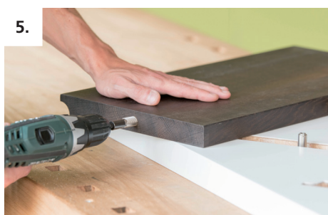
5. Atornille el conector Invis Mx 2 a la profundidad adecuada en el costado del peldaño