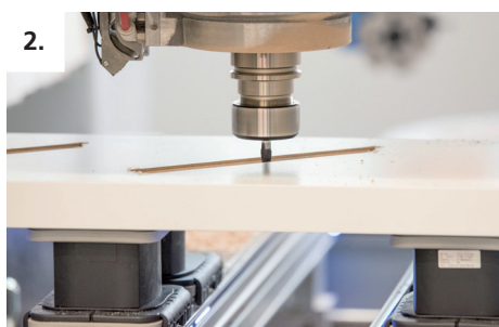
2. Haga un taladro en el encaje del peldaño