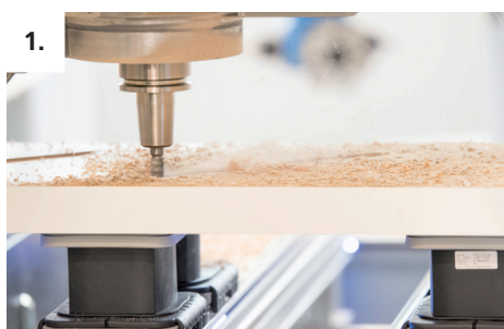
1. Fresar el encaje del peldaño en la zanca