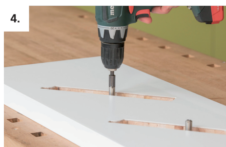
4. Atornille el bulón Invis Mx 2 en la zanca a ras, en el encaje del peldaño