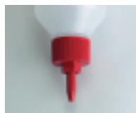
Spitzdüse Art. 335522