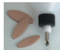
Metalldüse Art. 285512

Metalldüse für Plättchen Grösse H9 Art. 285509