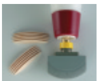
Düse für Minispot-Nuten Gr. 20 Art. 512891