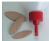
Buse en matière plastique No. d'art. 335511