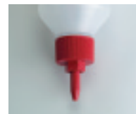
Buse pointue No. d'art. 335522