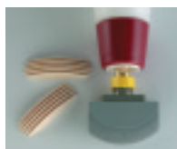
Buse pour rainures Minispot N° 20 No. d'art. 512891