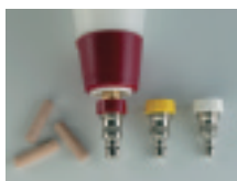
Buses pour trous de chevilles de Ø 8/10/12 mm No. d'art. 287027