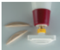
Buse pour rainures Minispot N° 2 et 22 No. d'art. 287022