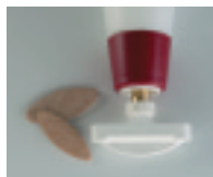
Buse pour rainures Lamello N° 20 et 10 No. d'art. 287020