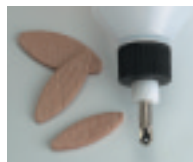
Buse en métal No. d'art. 285512