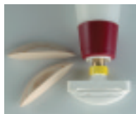
Buse pour rainures Minispot N° 4 No. d'art. 287024