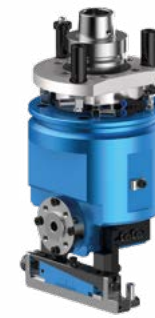
FLOATING H S Tastaggregat horizontal