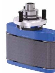
COLLEVO + Bandschleifaggregat für ebene Flächen, Außen- und Innenrundungen