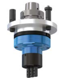
2 MULTI V3 Cabineo Mehrschindelkopf vertikal für Verbindertaschen für Verbinder Cabineo