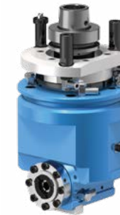
1 FLOATING H Tenso Tastaggregat horizontal für vertikale Nuten für Verbinder Tenso P-14