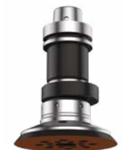
SIMOLO Exzentrerschleifaggregat für ebene Flächen, konvexe und konkave Flächen