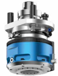
FLOATING V C Tastaggregat vertikal